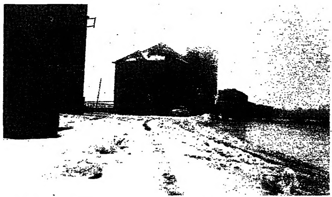
شلجيات متوقفة امام مخفر ضباط البيدر امس